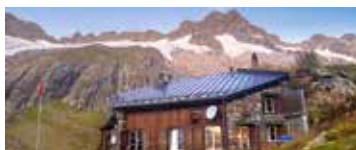
Voralphütte SAC, 2126 m Telefon +41 41 887 04 20 info@voralphuette.ch www.voralphuette.ch