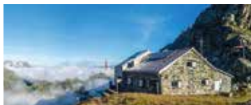
Camona da Medel SAC, 2524 m Telefon +41 81 949 14 03 info@medelserhuette.ch www.medelserhuette.ch