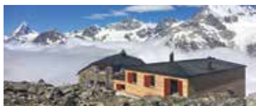
Domhütte SAC, 2940 m Telefon +41 27 967 26 34 info@domhuette.ch www.domhuette.ch