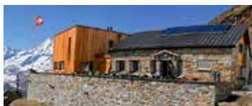
Täschhütte SAC, 2701 m Telefon +41 27 967 39 13 info@taeschhuette.ch www.taeschhuette.ch