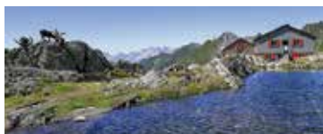
Capanna Cadlimo CAS, 2570 m Telefon +41 91 869 18 33 info@cadlimohuette.ch www.cadlimo.ch