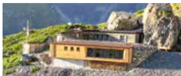
Spannorthütte SAC, 1956 m Telefon +41 41 637 34 80 info@spannorthuette.ch www.spannorthuette.ch