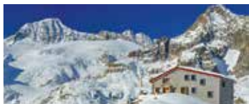
Albert-Heim-Hütte SAC, 2542 m Telefon +41 41 887 17 45 info@albertheimhuette.ch www.albertheimhuette.ch

Die sieben Hütten sind auch ideale Ausgangspunkte für fantastische Gipfeltouren. Gipfelziele studieren, Hütte reservieren, in den Bergen jubiliere. Los geht's!